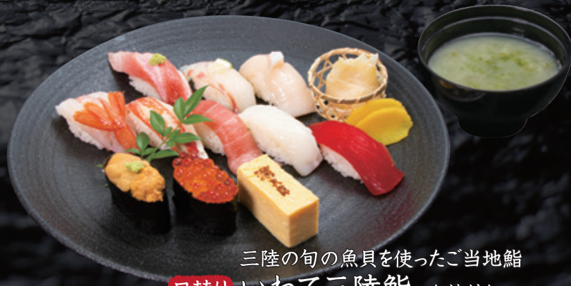
三陸の旬の魚貝を使ったご当地鮓 日替り いわて三陸鮓 お椀付き 一人前 3,000円 (税込3,300円)