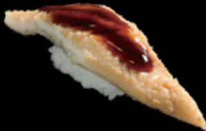
穴子 (一貫) 450 円 (税込 495 円)