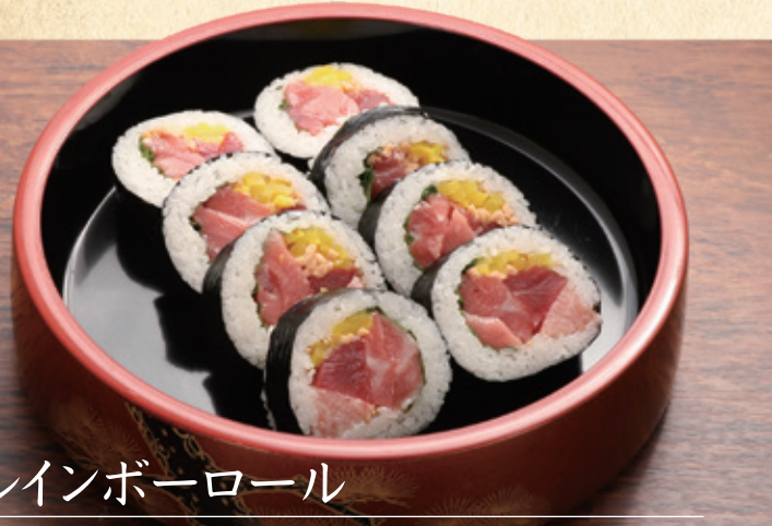
レインボーロール