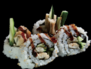
穴きゅう巻 (一本) 550 円 (税込 605 円)