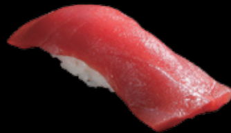
まぐろ (一貫) 450 円 (税込 495 円)