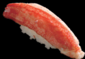
ずわい蟹 (一貫) 550 円 (税込 605 円)