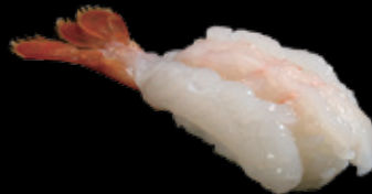
生えび (一貫) 450 円 (税込 495 円)