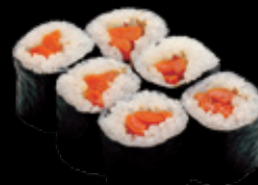
・山ごぼう巻 (一本) 250 円 (税込 275 円)