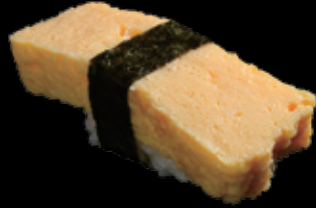
玉子 (一貫) 100 円 (税込 110 円)