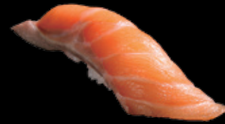
生サーモン (一貫) 250 円 (税込 275 円)