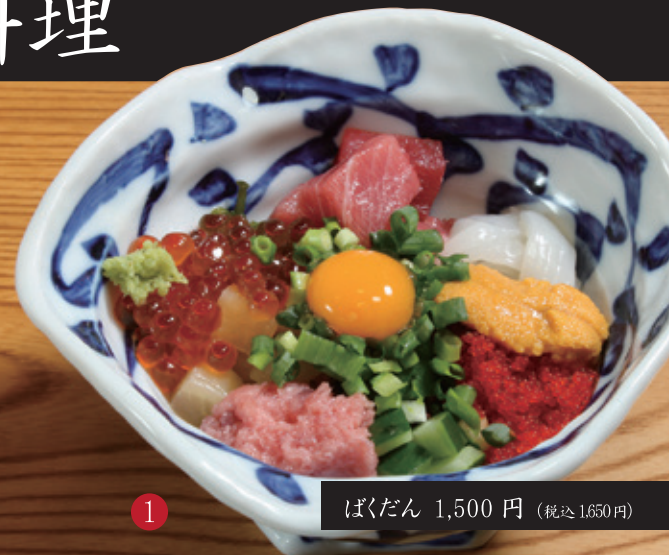
1 ばくだん 1,500 円 (税込1,650円)

当店の熟練板前が 丹精込めて仕込んだ逸品料理 上質な海鮮料理を お気軽にお楽しみ下さい