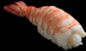
蒸し海老 (一貫) 250 円 (税込 275 円)