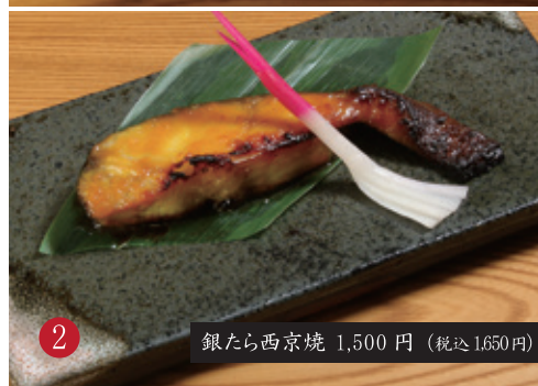
2 銀たら西京焼 1,500 円 (税込1,650円)