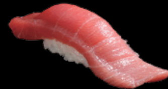
中とろ (一貫) 550 円 (税込 605 円)