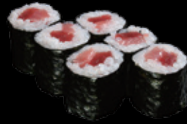
鉄火巻 (一本) 550 円 (税込 605 円)