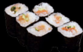
・南高梅巻 (一本) 350 円 (税込 385 円)