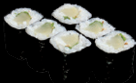
・お新香巻 (一本) 250 円 (税込 275 円)