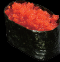
とびっこ軍艦 (一貫) 150 円 (税込 165 円)