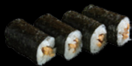
・納豆巻 (一本) 250 円 (税込 275 円)