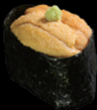
生うに軍艦 (一貫) 時価