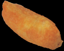
いなり (一貫) 100 円 (税込 110 円)