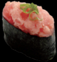
ねぎとろ軍艦 (一貫) 250 円 (税込 275 円)