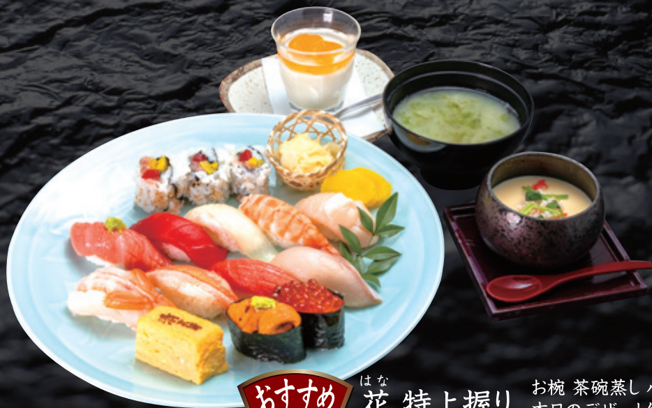
おすすめ はな 花 特上握り お椀 茶碗蒸し 小鉢 本日のデザート付き 一人前 3,700円 (税込4,070円)