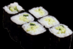
・かっぱ巻 (一本) 250 円 (税込 275 円)