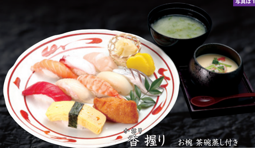
かきり 香 握り お椀 茶碗蒸し付き 一人前 1,800円 (税込1,980円)