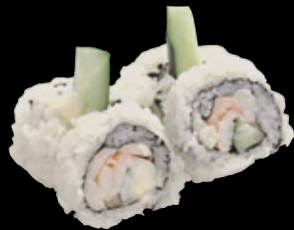
海老きゅう巻 (一本) 550 円 (税込 605 円)