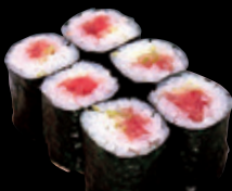
ねぎとろ巻 (一本) 550 円 (税込 605 円)