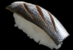
メ小肌 (一貫) 250 円 (税込 275 円)