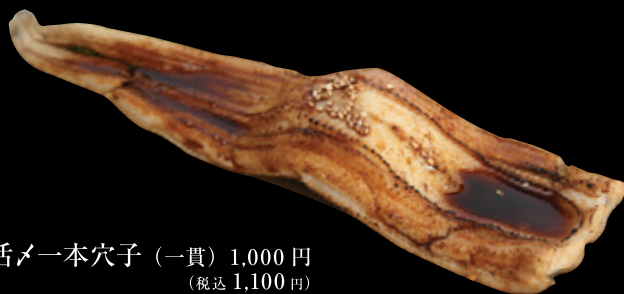
活メ一本穴子 (一貫) 1,000 円 (税込 1,100 円)