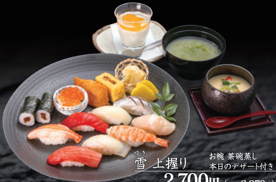
ゆき 雪 上握り お椀 茶碗蒸し 本日のデザート付き 一人前 2,700円 (税込2,970円)