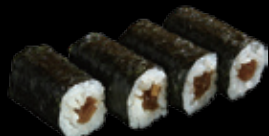
・干瓢巻 (一本) 250 円 (税込 275 円)