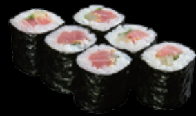
とろたく巻 (一本) 1,000 円 (税込 1,100 円)