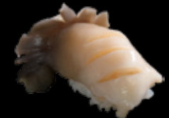
北寄貝 (一貫) 450 円 (税込 495 円)