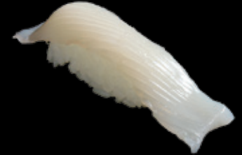
真いか (一貫) 150 円 (税込 165 円)