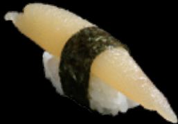
数の子 (一貫) 350 円 (税込 385 円)