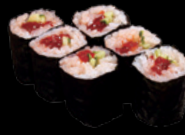
まんぼ巻 (一本) 550 円 (税込 605 円)