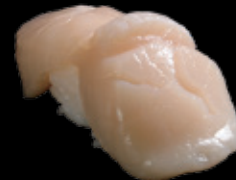
活帆立 (一貫) 450 円 (税込 495 円)