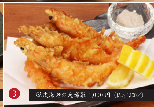
3 脱皮海老の天婦羅 1,000 円 (税込1,100円)