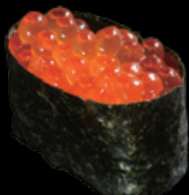
いくら軍艦 (一貫) 550 円 (税込 605 円)