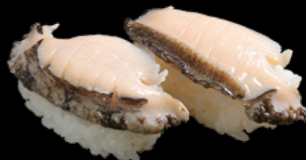
活あわび (二貫) 1,000 円 (税込 1,100 円)