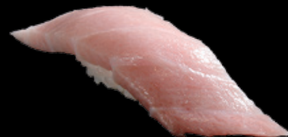
大とろ (一貫) 650 円 (税込 715 円)