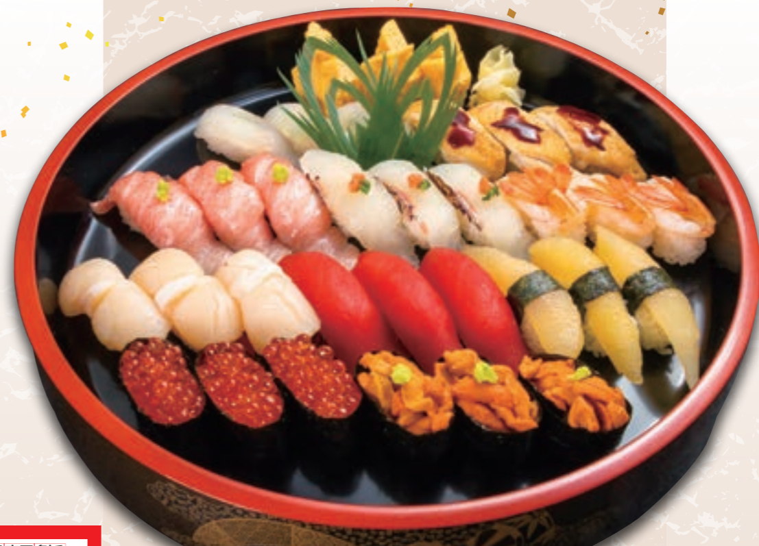
※写真は板長おすすめ盛り [3人前] のイメージです。

※メニューは最新のものをご確認の上ご注文ください。金額や内容が変更している場合があります。店舗では最新の商品内容でご注文を承っております。ご了承ください。